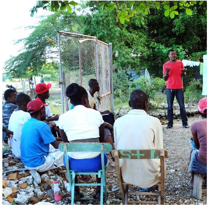
Formation technique Terra Preta (Karl Harald Bier)