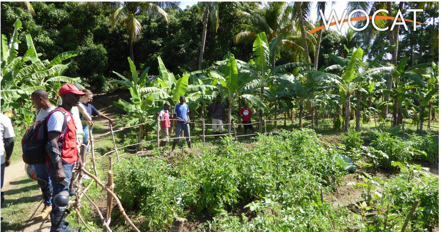
Visite conjointe entre techniciens CRS et bénéficiaires à des jardins Terra Preta de démonstration