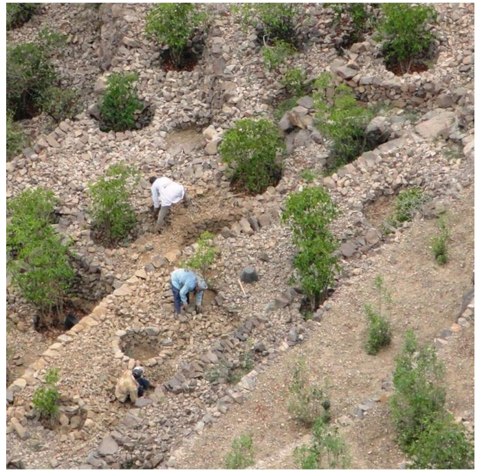
Covering soil with small stone and leaving small portion for coffee plantation. (Abdullah)