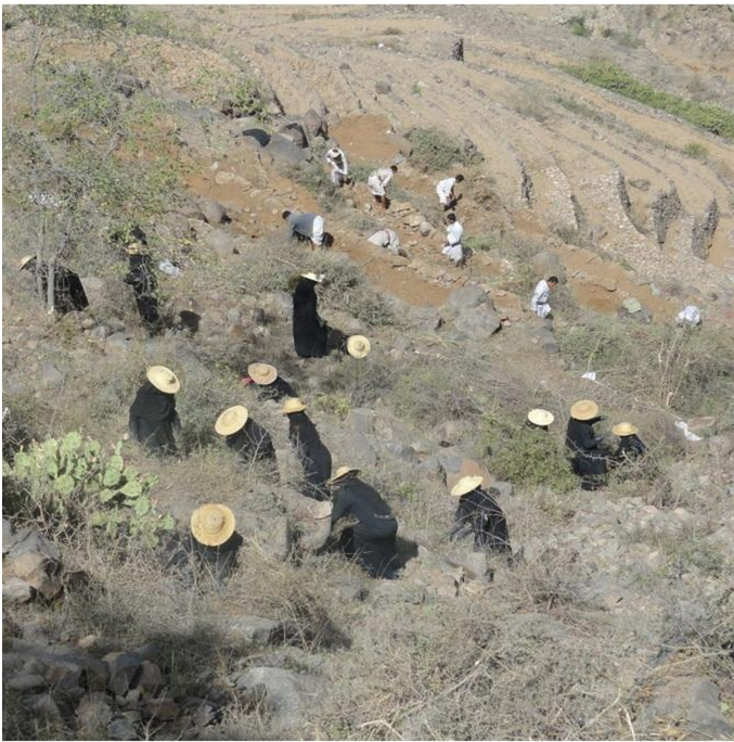
Men responsible for rehabilitation terraces, while women responsible for agricultural practices such as weeding. (Abdullah)