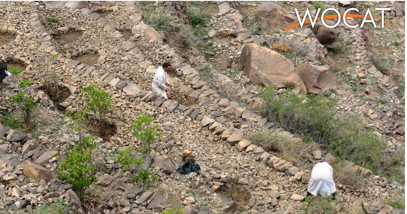
Building walls terraces (Abdullah)