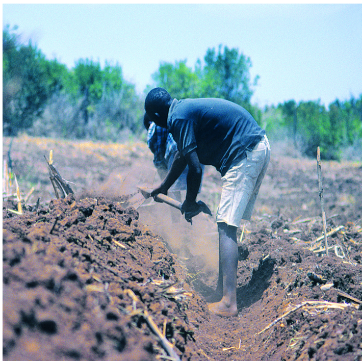
Construction of fanya juu terraces is heavy work. The name fanya juu means 'throw it up' in Swahili and refers to the first step of establishment: ditches are excavated and the soil is thrown upslope to form an embankment (Hanspeter Liniger)