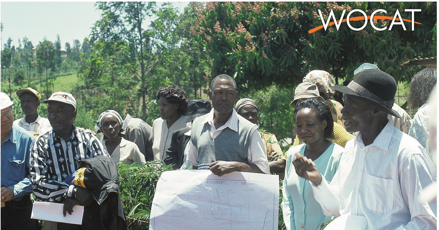
Catchment planning in action: local farmers and extension workers discuss technical interventions based on a participatory map.