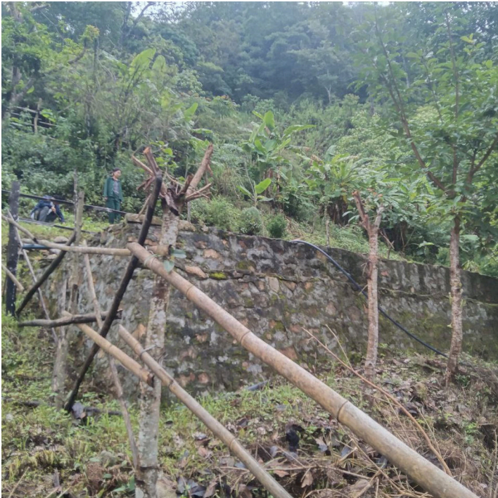
Water harvesting pond (Thinley Penjor Dorji)