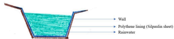
Figure 2 : Cross section Plastic lined water harvesting pond