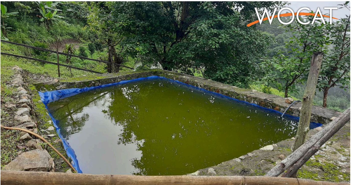
Low-cost plastic-lined water harvesting pond (Thinley Penjor Dorji)