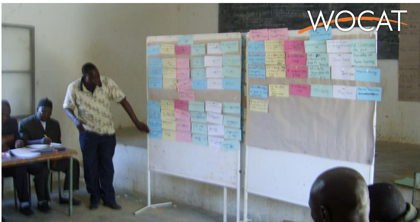
Presenting the results (PACT)