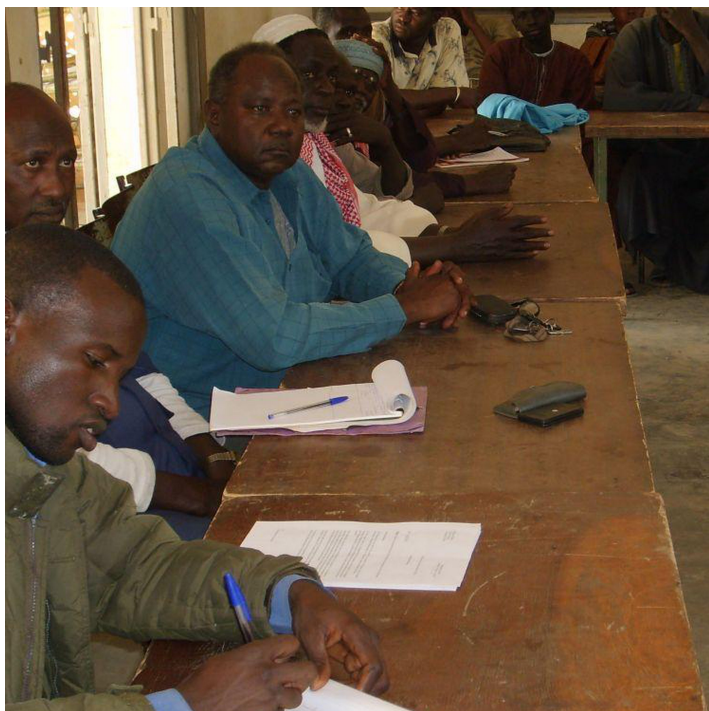
Consultation meeting of actors (PACT)

schedule, identifies obstacles to implementation and communicates these to consultation framework actors so they can find solutions and move forward with a new action plan.