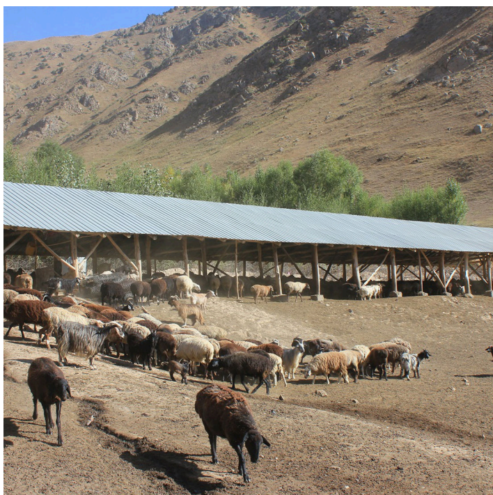
Livestock roaming in the close pasture before moving to the remote/summer pasture (Ibrohim Boronov)