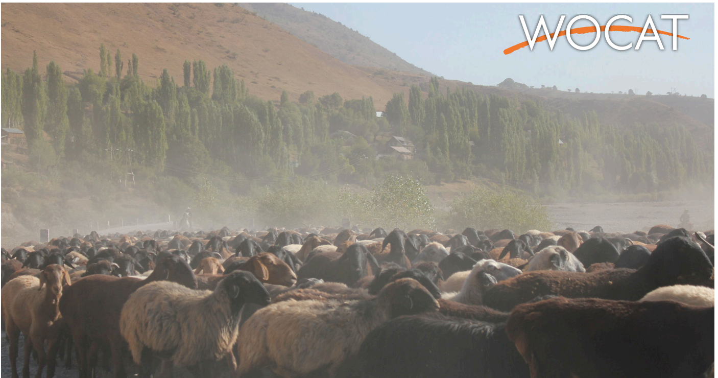
Herds movement to the summer pasture (Zevارشoev Askarsho)