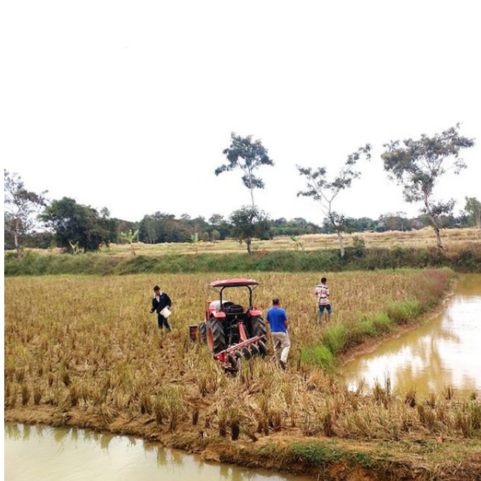
Rice products (Yuthasong Namsai)