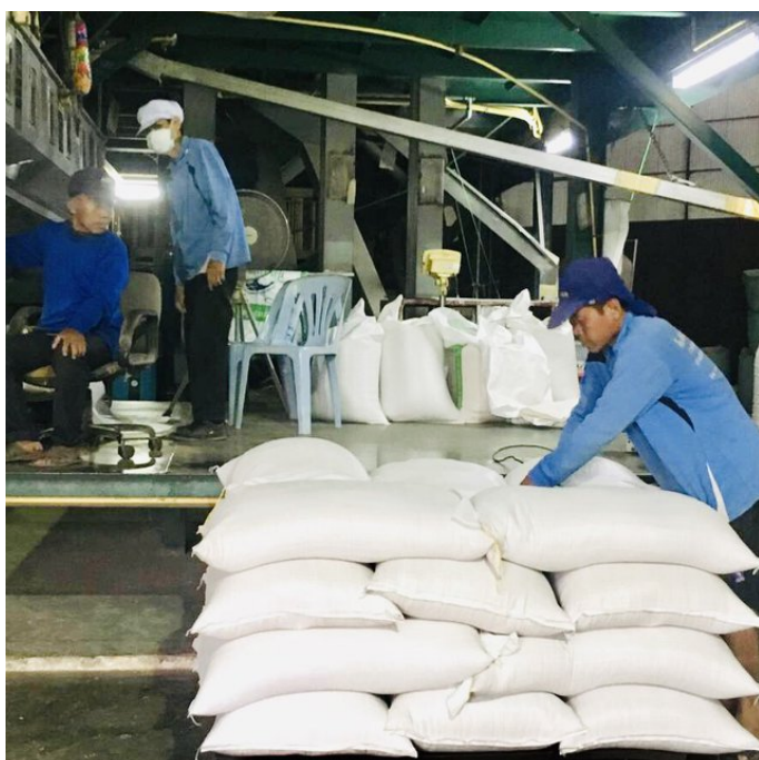
Organic rice products (Yuthasong Namsai)