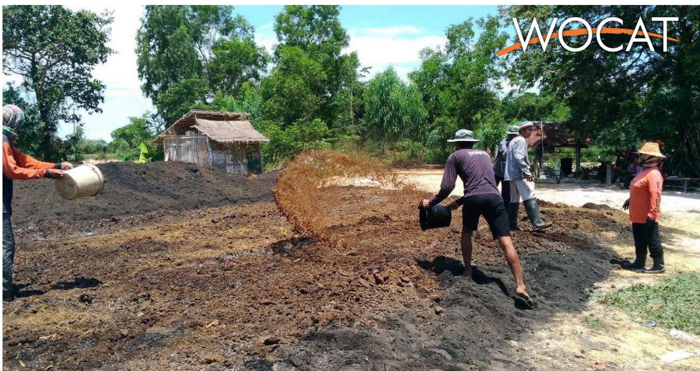
Farmer mixing compost. (Pranode Somchaiyaphum)