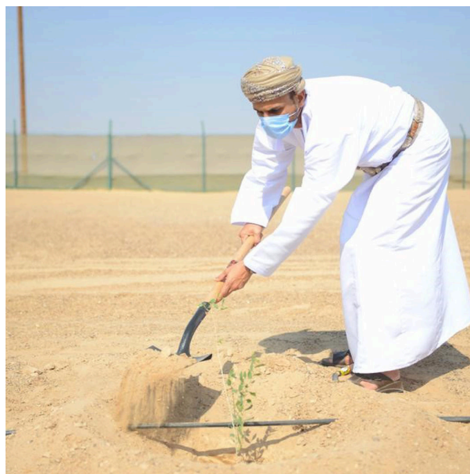
The chairman of the Environment Authority planting a wild tree