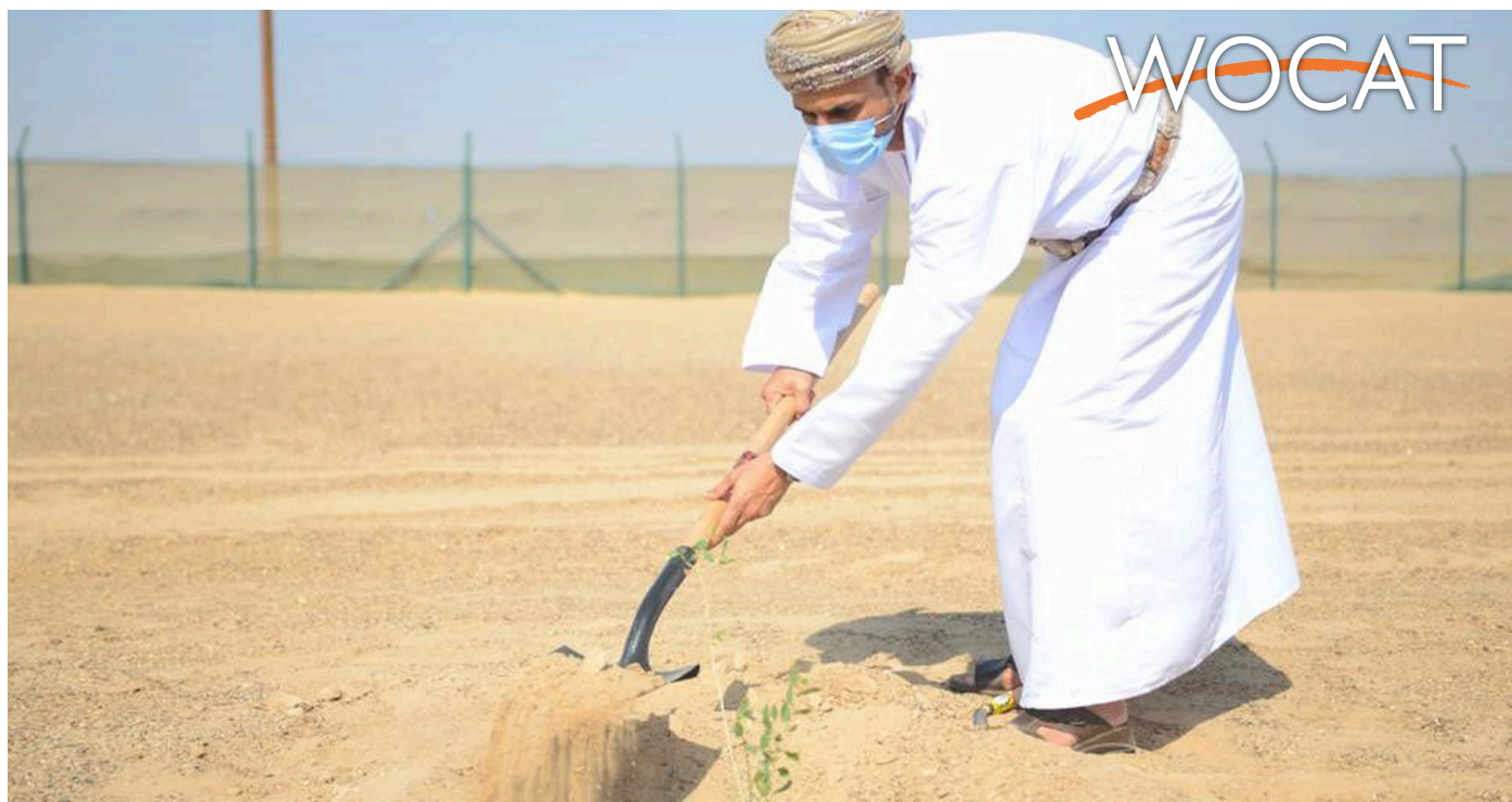
The chairman of the Environment Authority planting a tree