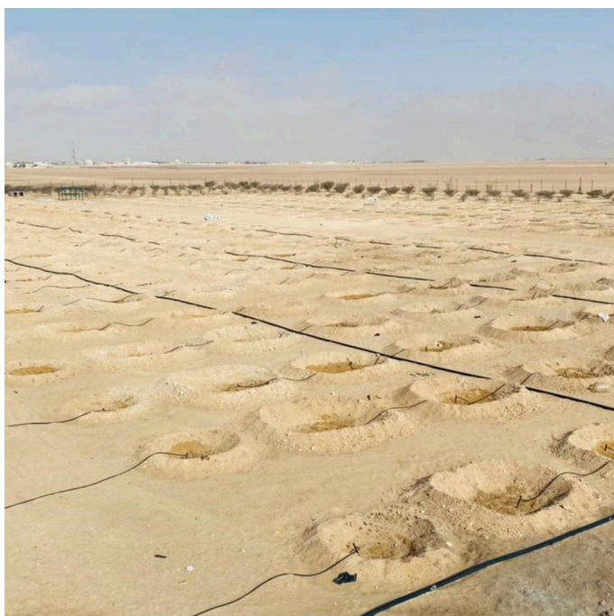
One of the planting sites