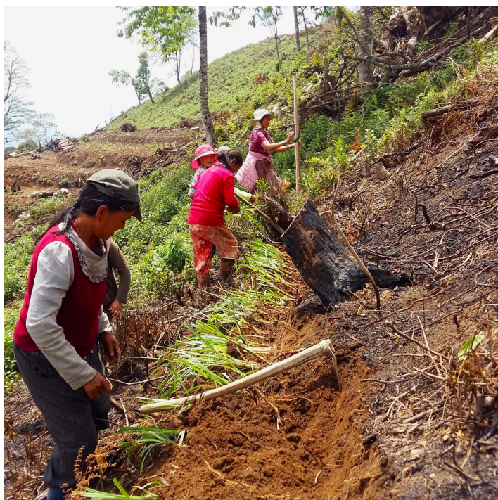
Hedge establishment by the land users (Haka Drukpa)