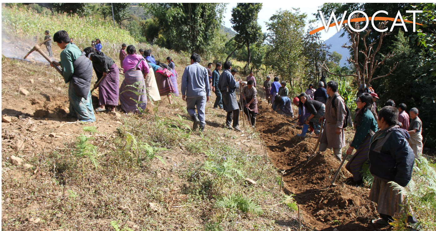
Community members engaged in SLM implementation (Sonam Wangchuk)