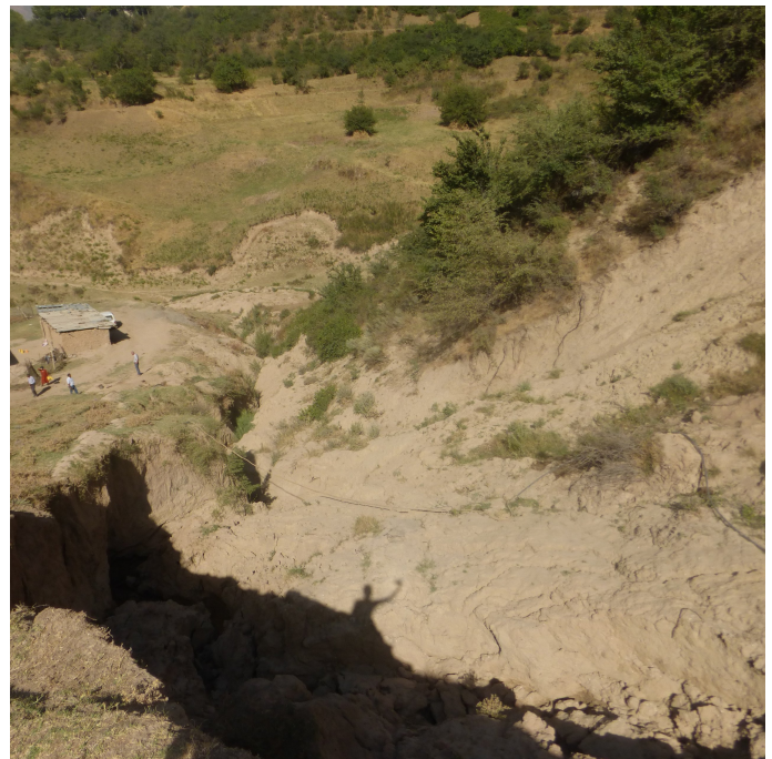
Small scale landslide triggered by heavy rains and combined with loss of vegetation cover due to deforestation and overgrazing. (Fazila Beknazarova )