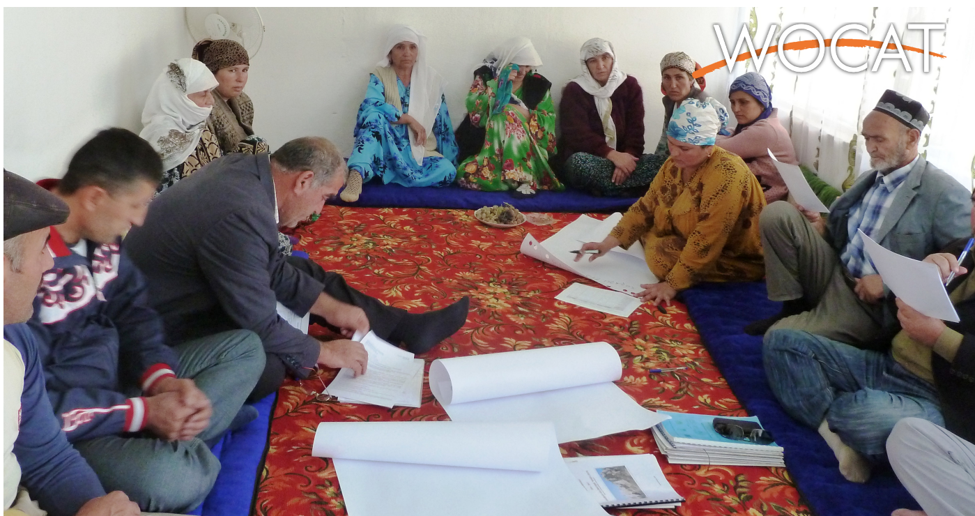
Pasture User Union meeting in Tajikistan (Margaux Thain)