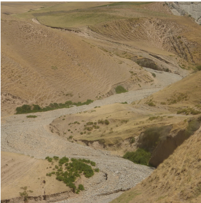
Watershed degradation and loss of vegetation cover by overgrazing and trampling of animals. Pasture User Unions regulate grazing to reduce and halt land degradation, for example by keeping animals on slopes on defined paths to the pastures to reduce destruction of vegetation by trampling. (Fazila Beknazarova )