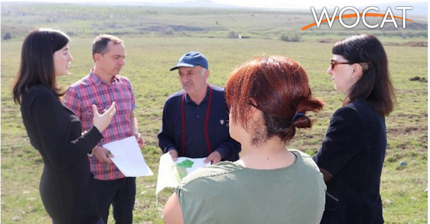
Stakeholder discussion during a field visit in Kareli Municipality (Daniel Zollner)