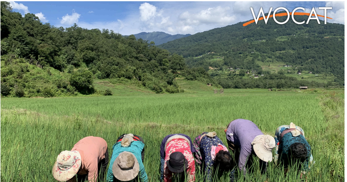
Labour-sharing group involved in weeding paddy in Bumdeling, Trashi Yangtse: Bhutan. (Tshering Yangzom)